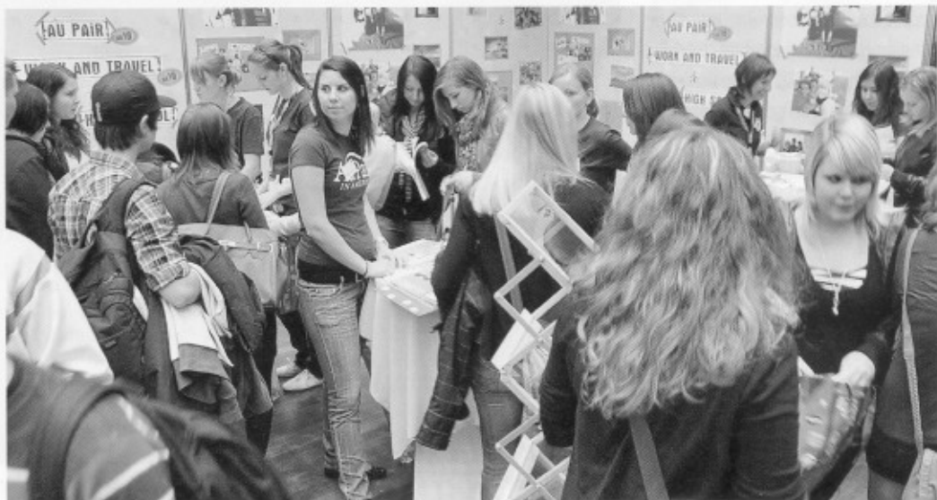
Die Bilder sprechen für sich: dichtes Gedränge bei Abi – was dann?

Dabei präsentierte sich auch die IHK mit ihren derzeit rund 100 Mitarbeitern und einem halben Dutzend Auszubildenden als attraktiver und begehrter Ausbildungsbetrieb für Büro- und Veranstaltungskaufleute sowie für Fachinformatiker für Systemintegration.